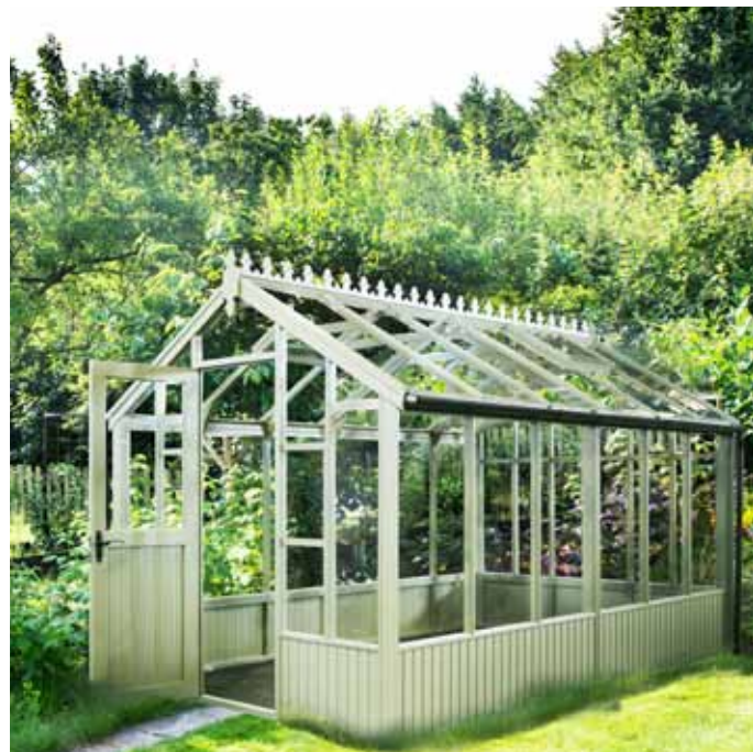
Växthuset Greta 9,9 m 2 i färgen Strandråg och med snickarglädjen Lilja

För mer information och tillgång till bildbank vänligen kontakta: Johan Olsson; johan@idagard.se tel: 0735-192030