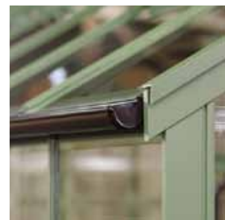
Avvattningssystem som tillval