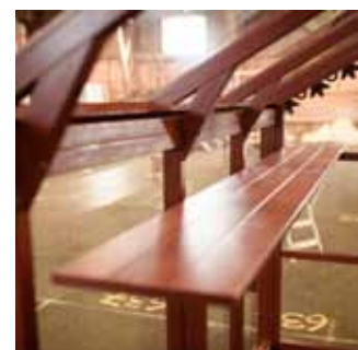
Hyllplan som tillval